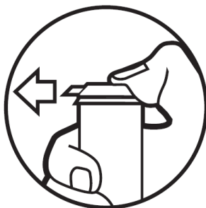
Skjut fliken framåt